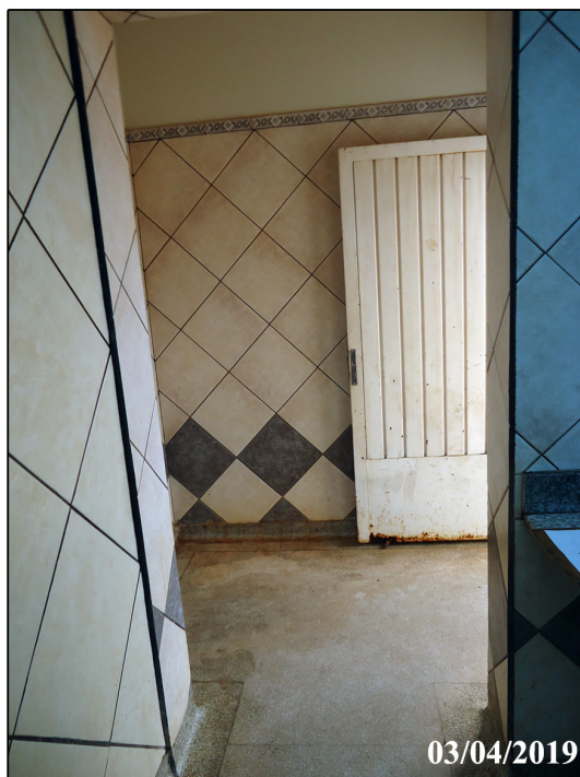
Vista interna do lavatório para o Hall de entrada