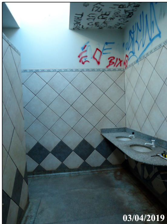
Vista da bancada com lavatório Banheiro Masculino