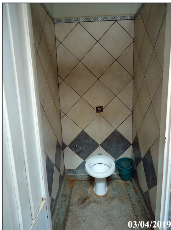
Vista interna 02