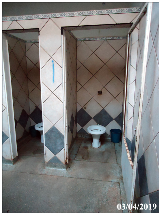
Vista do corredor de acesso aos sanitários