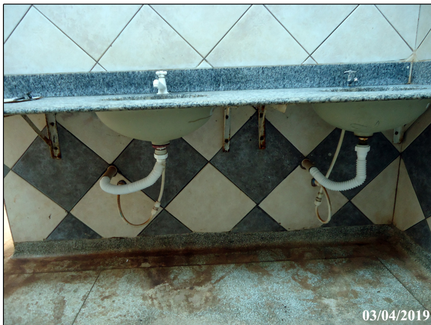
Vista frontal da bancada