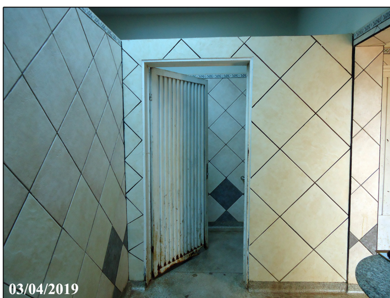
Vista entrada banheiro para PNE