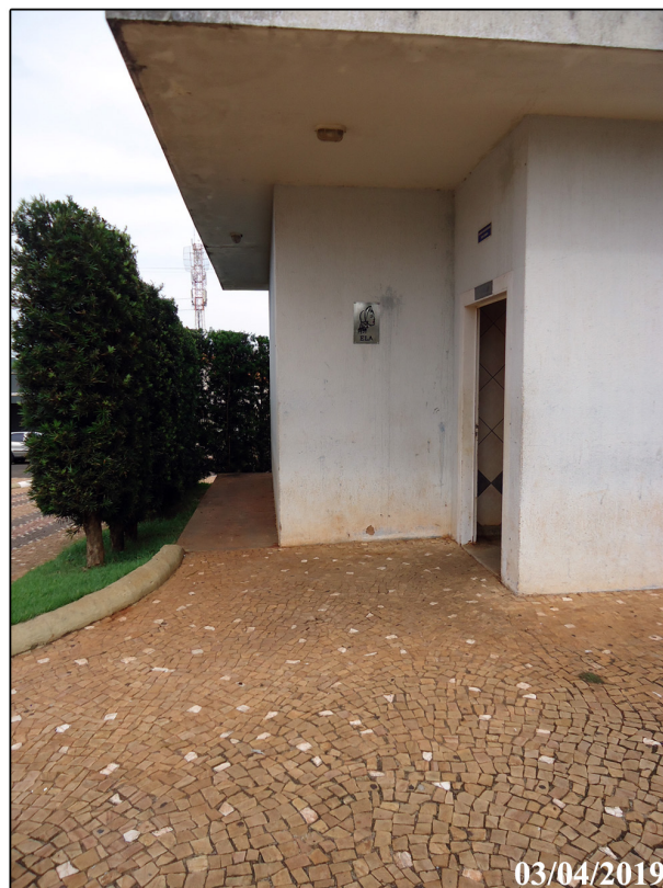
Vista entrada banheiro feminino