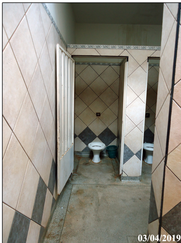
Vista interna banheiro feminino