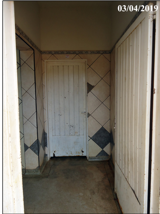
Hall de entrada