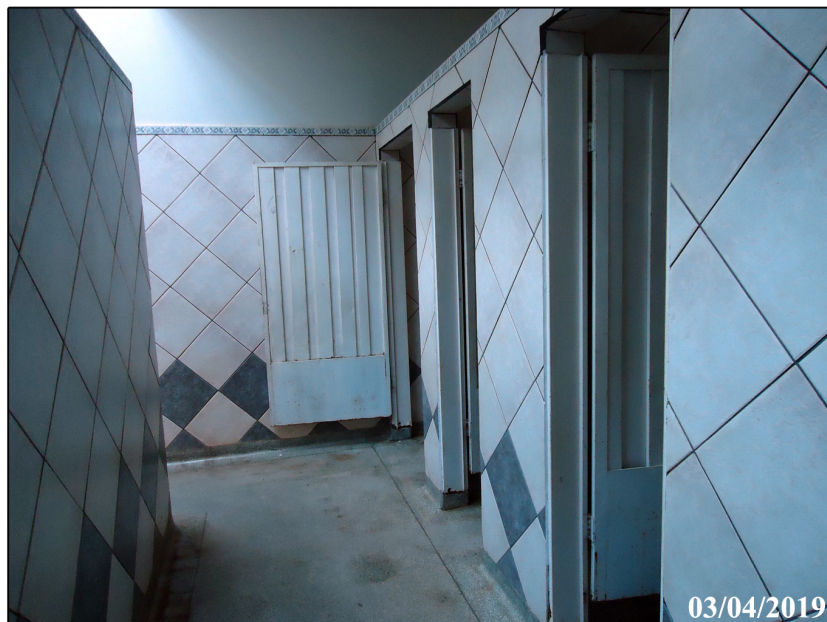
Vista corredor de acesso aos sanitários