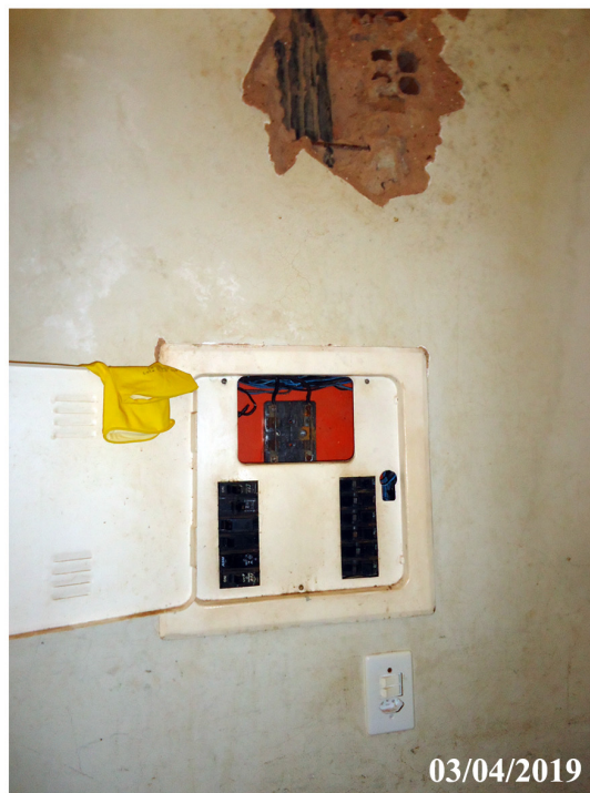
Quadro de Energia dentro do Depósito