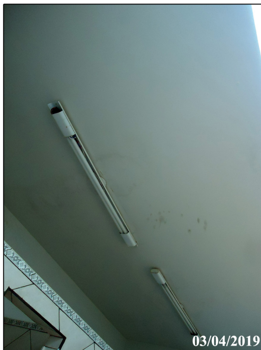
Vista da laje com alguns focos de infiltração