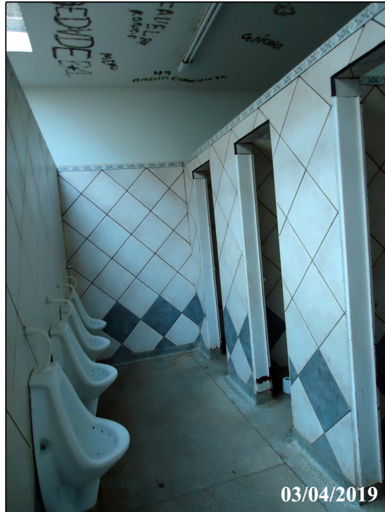
Corredor de acesso com mictórios