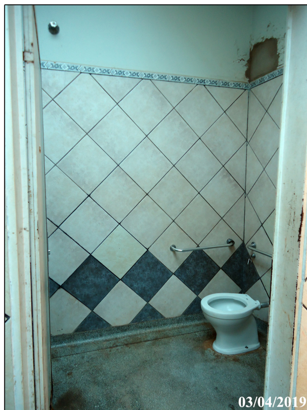
Vista banheiro para PNE