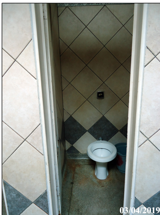
Vista iterna 03