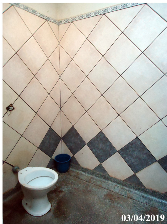
Banheiro PNE Masculino